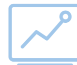
数字化、智能化的质量管理模式

辽宁国大拥有门店 918 家，分布在两省八市。如何对下属门店有效的监督与指导，保证门店质量