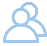
要有大局观，讲究协同作战