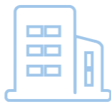
优质、规范的到店环境

2022年7月，盛世店是公司第一批质量标准化示范门店，为树立标准的样板店，门店所有员工依据公司陈列标准布局要求对门店不规范的陈列做好调整，特别是店长连续在店加班几天完善药品陈列以及休息区和收银台的整理整洁。收银台作为每个顾客进店后必经必看的地方，可以反映一个门店整体形象，我们努力给顾客塑造一个优质、规范的到店环境，盛世店的客流量同比增长了很多；不只是营业区，员工休息区我们店也严格按照质量标准做到整齐划分。